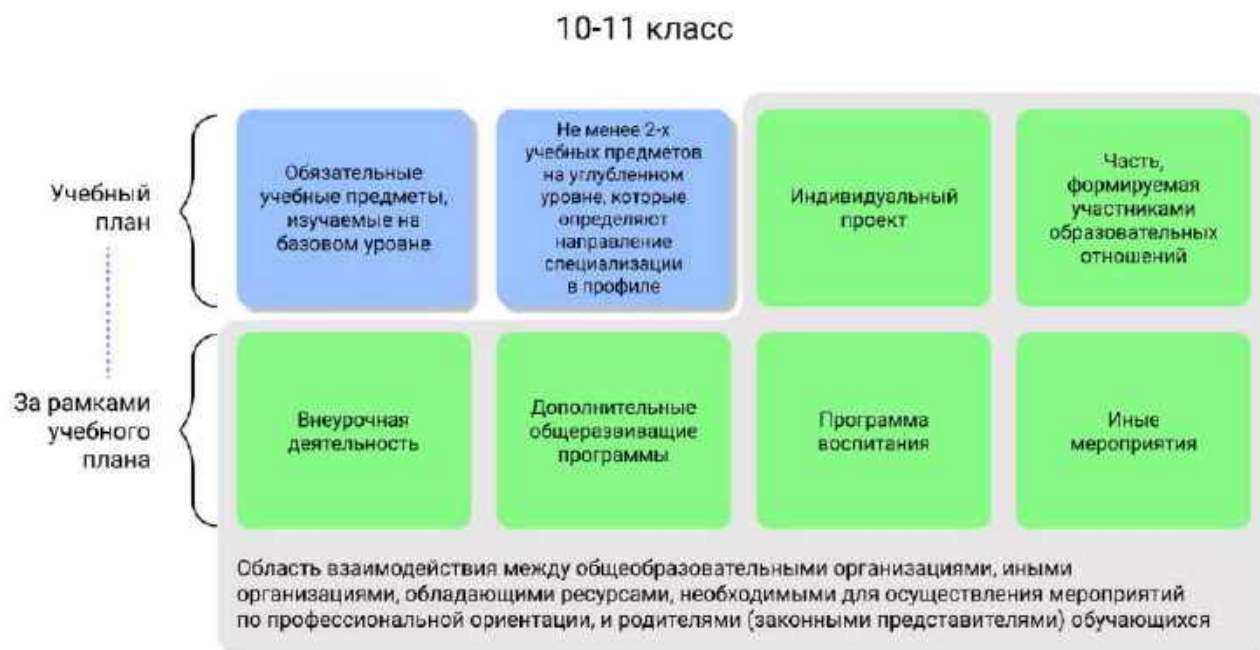
Рисунок 1 – Единая модель профориентации в профильных предпрофессиональных классах – область взаимодействия между общеобразовательными организациями и партнерами

Разработка основной образовательной программы для профильных предпрофессиональных классов проводится с учетом мнения всех категорий участников Единой модели профориентации, представленных на уровне субъекта Российской Федерации, муниципалитета.